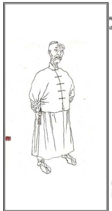
Рис. 1. Мэй Цин. Неизвестный автор [ https://bking.cdn.bcebos.com/pic/58ee3d6d55fbb2fb64a7601d4d4a20a44623dc34?x-bce-process=image/resize,m_lfit,w_536,limit_1 ]

Аристократическая родословная в сочетании с семейным воспитанием с раннего возраста определила увлечения и интересы Мэй Цина, проявлявшего уникальные таланты в самых разных областях искусства: живописи, поэзии, литературе, музыке. Он с детства очень любил читать,