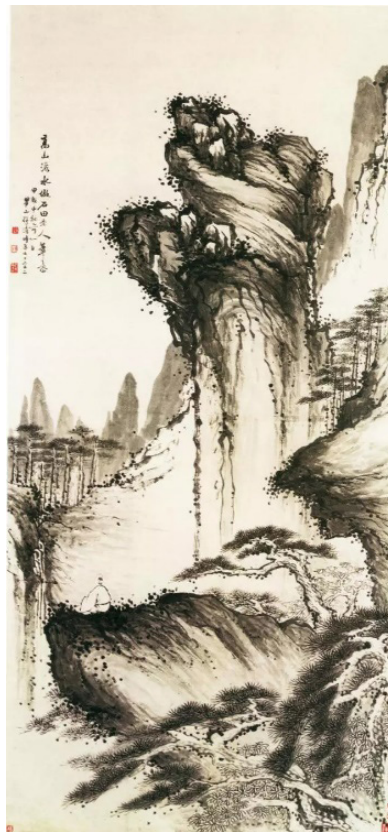
Рис. 4. Мэй Цин. Желтые горы. Карта высокогорных вод. Коллекция музея Аньхой

В заключение отметим, что в творчестве Мэй Цина, с одной стороны, находит органичное продолжение имажинативный пейзажный стиль китайских мастеров, который пытается запечатлеть дух Дао. С другой стороны, картины Мэй Цина обладают неповторимой эстетической выразительностью и индивидуально-яркой экспрессивностью, открывая перспективы художникам-соотечественникам для дальнейших творческих исканий.