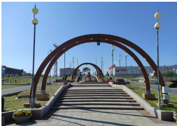
Рисунок 10. Парк «Юбилейный» 8 Figure 10. Yubileyny Park

Однако, этого пространства недостаточно для полноценной реализации всех потребностей местного населения. Часто для отдыха и развлечений люди ездят в столицу ЯНАО — город Салехард. Он находится на другом берегу реки Обь и доступ туда бывает затруднительным: мостов через реку нет, летом сообщение между городами паромное, а зимой — по льду. Соответственно, бывают периоды (осень, весна) когда сообщение осуществляется судами на воздушных подушках или вертолетом. Поэтому есть необходимость предоставить жителям альтернативные способы досуга в родном городе, без необходимости ездить в другой город.