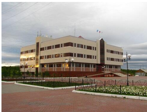
Рисунок 9. Администрация г. Лабитнанги 7 Figure 9. Administration of Labytnangi