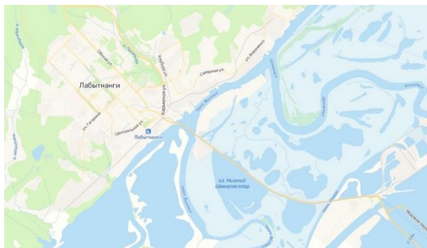
Рисунок 1. Город Лабытнанги на берегу протоки Вылпосл и дорога на Обской причал 1 Figure 1. The town of Labytnangi on the banks of the Vylposl bayou and the road to the Ob pier

Город находится на берегу протоки Вылпосл. Направление русла протоки в этом месте — юго-западное. Протока является своеобразной планировочной осью города. Его планировочная структура представляет собой ортогональную сетку, ориентированную по берегу протоки (рисунок 1).