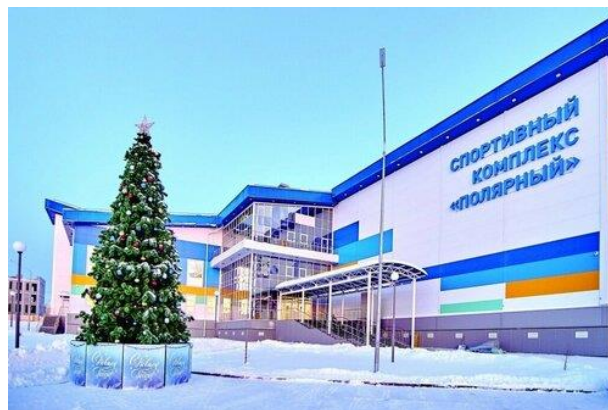
Рисунок 4. Спортивный комплекс «Полярный» 3 Figure 4. Polyarny Sports Complex

Спортивную зону образуют здание плавательного бассейна с универсальным спортивным залом, комплексы «Полярный» и «Авангард», стадион, она расположена вдоль одной из главных улиц и составляет ее фасад. К спортивной зоне, в глубине микрорайона, прилегает территория детского сада. Детский сад расположен в центре квартала, удален от магистральных улиц, что снижает уровень шума, а свободное пространство вокруг способствует хорошему уровню инсоляции. Все эти сооружения построены относительно недавно (2010–2015 гг), выполнены в едином стилевом решении. Архитектура зданий строится на сочетании крупных объемов, активного выделения входной части, подчеркнуто-ярким цоколем и парапетом, яркими врезками. Цветовая гамма фасадов представляет собой белый основной цвет и цветные яркие акценты: синий, голубой, желтый, оранжевый либо серый, красный. Цвет здесь играет важную роль — в условиях длительного отсутствия солнечного света яркие акцентные цвета восполняют цветовое голодание (рисунки 4, 5, 6).