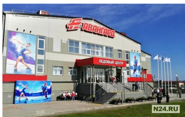
Рисунок 5. Ледовый центр «Авангард» 4 Figure 5. Avangard Ice Center