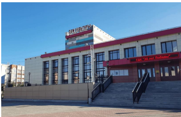
Рисунок 8. Дом культуры «30 лет Победы» 6 Figure 8. House of Culture “30 years of Victory”