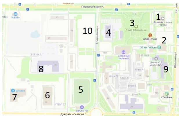
Рисунок 3. Центральная часть города Лабитнанги 2 Figure 3. The central part of the city of Labytnangi

В геометрическом центре поселения, в равной доступности от всех концов города расположены наиболее важные городские объекты. Между улицами Дзержинского и Первомайской, в кварталах по обеим сторонам ул. Студенческой находится администрация города (рисунок 3. №1), Дом культуры с большой площадью для городских мероприятий (рисунок 3. №2), недавно отреставрированный парк «Победы», большой парк «Юбилейный» (рисунок 3. №3), Футбольное поле ОМСК «Арктика» (рисунок 3. №5), Хоккейная арена «Авангард» (рисунок 3. №6) и «Спортивно-оздоровительный комплекс с универсальным спортивным залом и плавательным бассейном» (МАУ СШ «Юность») (рисунок 3. №7). Центр города имеет зеленые насаждения вдоль главных улиц, парк, сквер и другие «зеленые» участки. Данная территория имеет хорошую пешеходную сеть, включающую тротуары, прогулочные скверы, парковые дорожки, необходимые для пешеходной доступности к общественным объектам, прогулок и общения. Здесь проходят почти все линии маршрутов общественного транспорта (6 остановок). Здесь же находятся школы (рисунок 3. №9) и детские сады (рисунок 3. №4,8), жилая застройка.