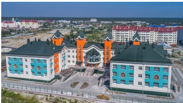
Рисунок 6. Детский сад «Снежинка» 5 Figure 6. Snezhinka Kindergarten

В другом квартале находятся важные общественные здания, построенные в поздний советский период. Это школа №3 (рисунок 7.), недавно реконструированная, и представляющая собой светлое кирпичное здание интересной формы. Здесь также акцентирована входная часть. Над входом выдвинут объем спортивного зала, фасадная поверхность которого слегка вогнута и ритмично подчеркнута рядом пилонов.