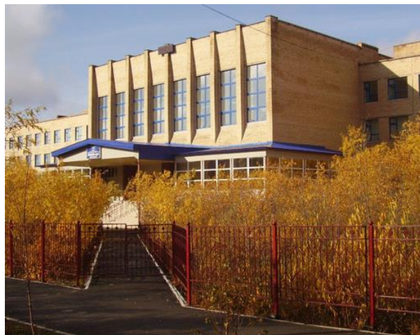
Рисунок 7. Школа №3 Figure 7. School No. 3

Здание городской администрации — более сдержанное по архитектуре. Здесь основную тему задает движение, образованное горизонтальными протяженными рядами заглубленных окон, объединенных темной отделкой, и светлыми глухими поверхностями между ними. Вертикальные «врезки» над входами, расположенные по центральной оси, останавливают это движение. Рядом с администрацией находится новый парк «Юбилейный» (рисунок 10.), который имеет интересный рисунок тропинок и зоны озеленения. По ул. Студенческая расположен детский сад, который отделяется от улицы озелененной территорией. В глубине квартала находятся жилые здания средней этажности и небольшая коммунальная зона — гаражные блоки.