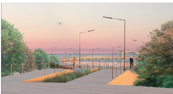
Рисунок 5. Вид на стрелку косы. Одегова А.И., Москалец Т.С. 401 гр