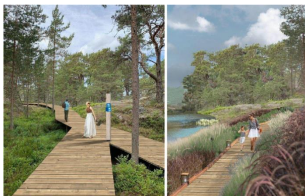
Рисунок 2. Организация пешеходных троп.

В число задач проектного исследования входило проектирование входных групп, организация на границе парковой зоны автомобильных парковок, здания администрации парка и хозяйственной территории, формирование сети пешеходных дорожек, проездов для служебного транспорта, мест организованного отдыха и площадок различного функционального назначения. В проектах также должно быть предусмотрено создание причалов для маломерных судов.