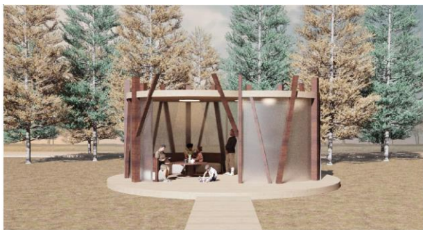
Рисунок 3. Вариант беседки. Одегова А.И., Москалец Т.С. 401 гр