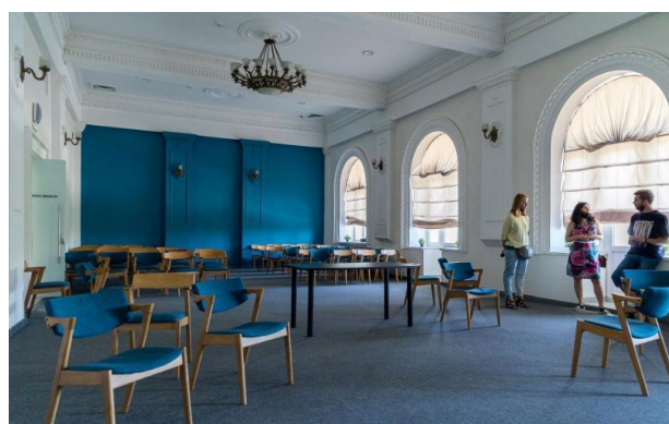
Рисунок 4. Студия в Арт-резиденции «Каменка», Касноярск 2

Само здание было полностью отремонтировано, с учетом обновленной концепции и новых направлений работы. В рамках арт-резиденции «Каменка» предусмотрены современные пространства для репетиций, мастер-классов, выставочных экспозиций и проведения мероприятий различного формата (рисунок 4, 5). Особое внимание уделяется созданию условий для взаимодействия молодых артистов и профессионалов, а также для развития креативных инициатив в регионе. Также в подвале расположилось Пространство «Каменка.Цех», которым пользуются резиденты, а на первом этаже арт-маркет, где продается продукция резидентов.