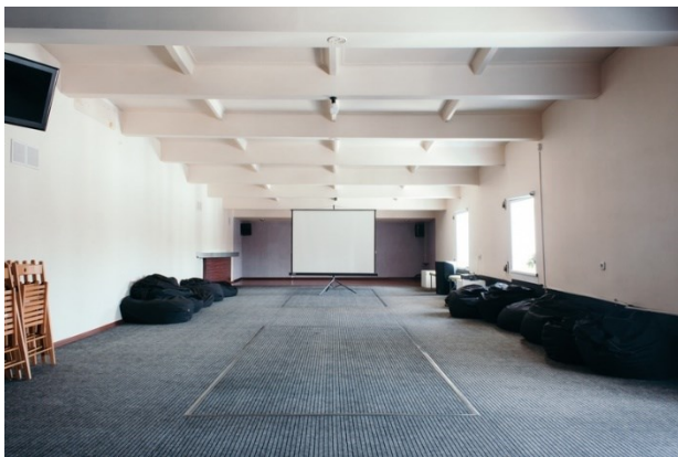
Рисунок 2. Творческое пространство «Чердак» в Арт-резиденции «Юность», Новосибирск 1

Figure 2. Creative space «Cherdak» in the Yunost Art Residence, Novosibirsk.