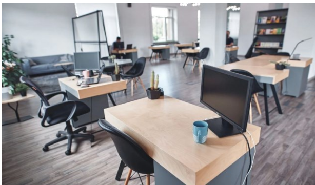
Рисунок 5. Коворкинг в Арт-резиденции «Каменка», Красноярск 3