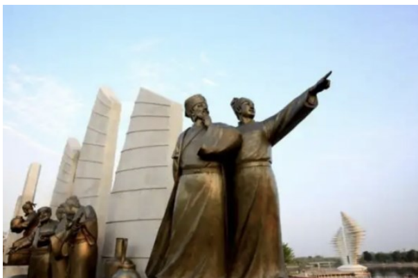
Рисунок 8. Скульптурная группа на тему «Морской Шелковый путь». Цюаньчжоу, Китай 3