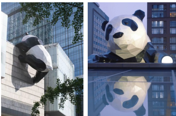
Рисунок 7. Лоуренс Арджент. «Я здесь», 2014 г. Чэнду, Китай 12

уникальной душой. Они основаны на местных исторических хрониках, народных традициях, диалектах и уникальных природных ландшафтах, что может вызывать сильный эмоциональный резонанс и чувство идентичности у местных жителей [Пань Синьян, Чжао Чжихун, 2021]. Например, элементы панды часто встречаются в паблик-арте Чэнду (рис. 7, 8). Эти работы сочетают в себе как визуальное воздействие современного искусства, так и уникальную интимность и веселье Чэнду.