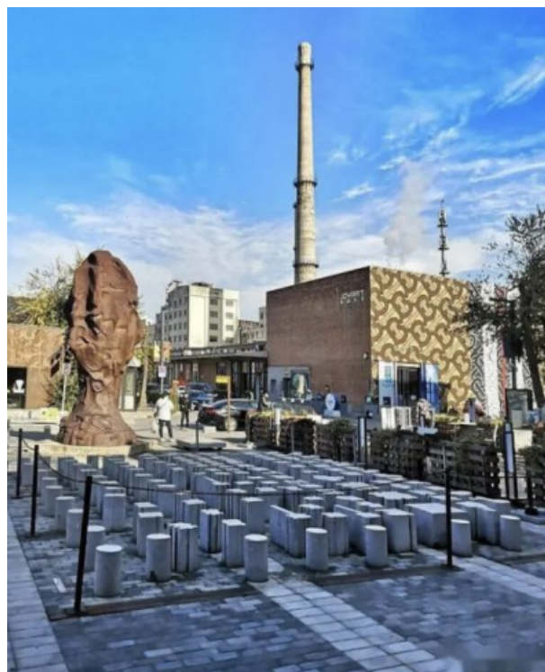
Рисунок 9. 798 блоков. Пекин, Китай 4

ативе «Один пояс, один путь» в портовых городах, таких как Гуанчжоу и Цюаньчжоу в Китае, включают в себя исторический контекст и морскую культуру местного Морского Шёлкового пути, используя региональные визуальные символы для повествования о «сообществе с общим будущим человечества» (рис. 9). Это позволяет паблик-арту воплощать волю государства, будучи при этом укоренённым в народе, демонстрируя богатую многослойность и мощную жизненную силу.