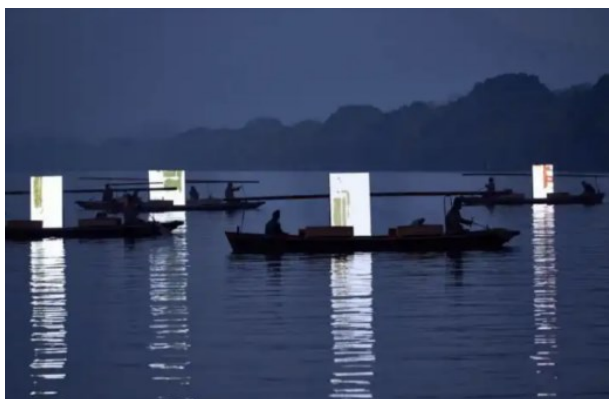
Рисунок 5. Китайская академия искусств. «Завтрашняя яркая луна», 2023 г. Ханчжоу, Китай 2

Ханчжоу, известный как «Город национального наследия» и «Цифровая столица», сочетает в себе богатое культурное наследие региона Цзяннань с передовыми технологическими инновациями, создавая уникальный городской облик, сочетающий классицизм и современность. Его городские особенности в полной мере отражены в общественном искусстве, положив начало диалогу между человечеством и технологиями (рис. 5).