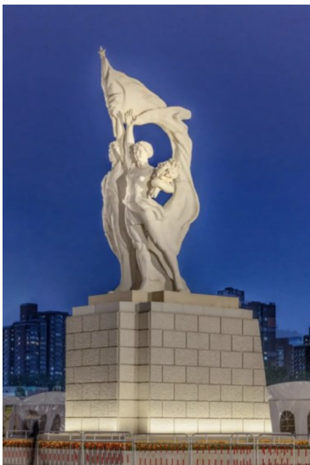
Рисунок 2. Рис. 2. Главная скульптура Стадиона рабочих, 1959 г. Пекин, Китай 1

Figure 2. The main sculpture of the Workers' Stadium, 1959 Beijing, China