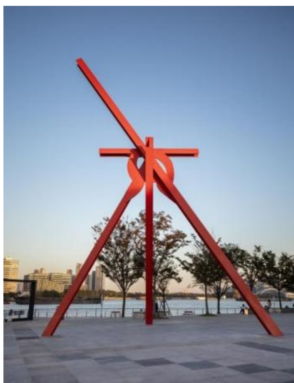
Рисунок 3. Марк ди Суверо. «Объятие», 2011 г. Шанхай, Китай 2

Figure 3. Mark di Suvero. "Embrace", 2011, Shanghai, China