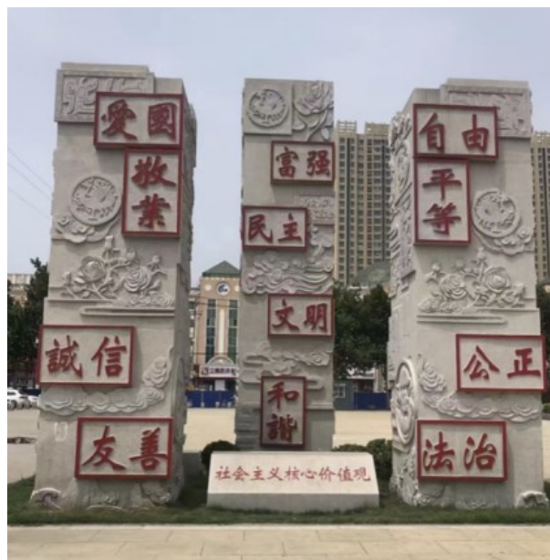
Рисунок 6. Демонстрационное устройство «Основные социалистические ценности» 3

В китайском публичном искусстве метанарративы выражаются через стандартизированные символы и тематические кластеры. Инсталляции на темы «дружелюбия» и «гармонии» можно увидеть повсюду в городе (рис. 6). Функция этих работ — формирование национальной идентичности и продвижение социальной цивилизации. Эти работы консолидируют господствующую идеологию и играют роль политического просвещения [Сунь Чжэньхуа, 2022].