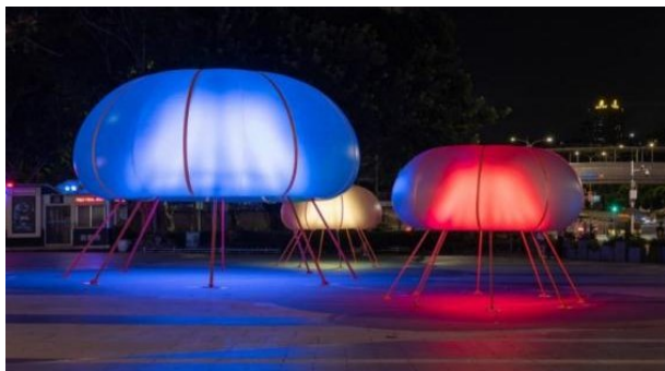
Рисунок 4. Се Цюнчжи. «Воображение света», 2023 г. Шэньчжэнь, Китай 1

Figure 4. Xie Qiongzi. "The Imagination of Light", 2023 Shen-zhen, China