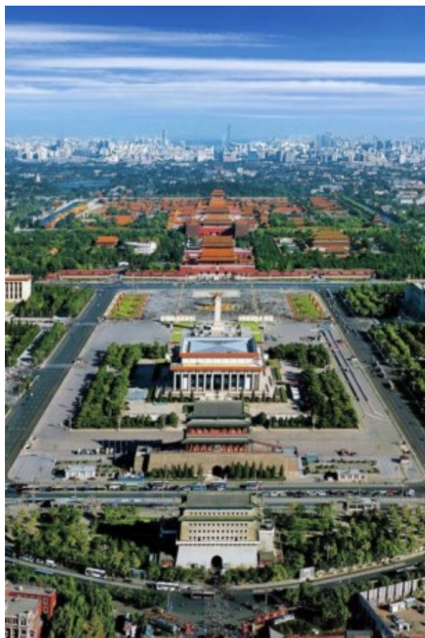
Рисунок 1. Рис. 1. Центральная ось города. Пекин, Китай 1

Наконец, историческое и культурное наследие может обеспечить городу ощущение стабильности и идентичности в периоды бурных социальных преобразований. Паблик-арт может служить связующим звеном между эпохами, а также между эпохами и людьми, посредством современной интерпретации исторических элементов.