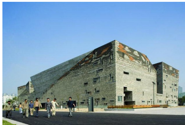
Рисунок 1. Ван Шу. Исторический музей Нинбо Figure 1. Wang Shu. Ningbo History Museum

Эта идея полномасштабно реализована в талантливом архитектурном проекте Ван Шу Исторический музей Нинбо 1 (2008), который является крупнейшим музейным комплексом Китая (рис. 1). Дизайнерская идея заключалась в органичном синтезе исторической ауры древнего города, философии гор и воды, с экспрессией современного мира. Используя выброшенные кирпичи, плитку, камни и другие местные материалы, Ван Шу включил региональные особенности и традиционные ремесла в современный архитектурный дизайн, реализуя принципы защиты культурно-исторической памяти и наследования традиционной культуры. Этот проект получил самое широкое признание на международном уровне, став ярким образцом интеграции современной архитектуры и традиционной культуры в Китае.