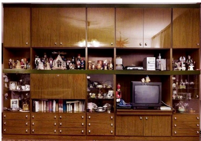
Рис. 5. «Стенка». 1980-е гг.

шкафы-стенки, составляемые из нескольких модульных секций, которые сочетают закрытые дверцами емкости и открытые полки (рис. 5). Функциональное назначение секций разнообразно и предусматривает хранение одежды, книг, посуды и других вещей [9, 11].