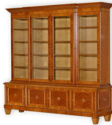
Рис. 4. Шкаф книжный, 1950 г.

в мире общества социальной справедливости» [6, 11]. Этот поворот проводился под тотальным государственным контролем и в соответствии с идеологическими и художественными предпочтениями руководства государства. Высокими темпами по всей стране разворачивается строительство жилья с увеличенной площадью проектируемых квартир, появляется запрос на мебель, в своем стилевом решении соответствующую масштабам помещений и архитектуре зданий [7].