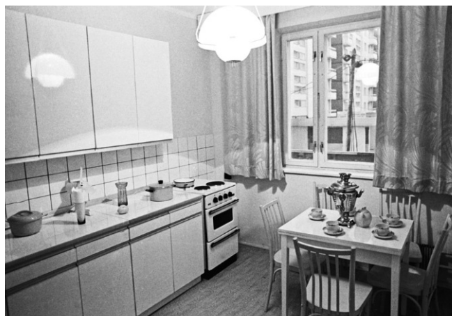
Рис. 6. Кухонный гарнитур, 1970-е гг.

В типологии корпусной мебели в этот период появляется градация на секционную — состоящую из одной секции — законченного изделия (или изготавливаемую в виде набора из