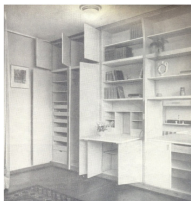
Рис. 2. Е. Семенова. Шкаф-перегородка, 1925 г.

— четвертый этап: середина 90-х — наше время.