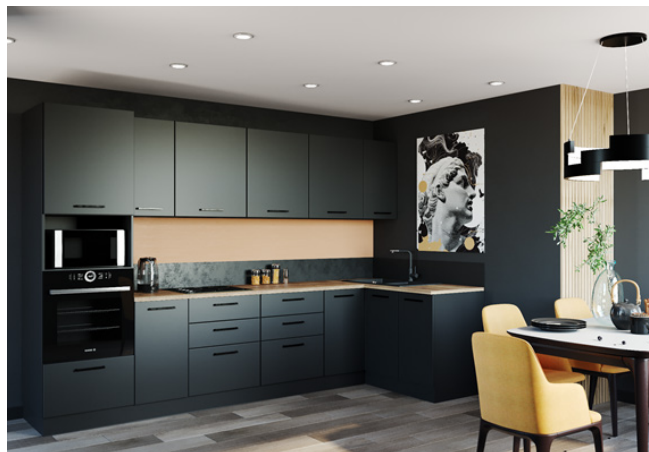
Рис. 7. Кухонный гарнитур, 2022 г.

Большую долю изготавливаемой корпусной мебели занимают изделия, выполненные по