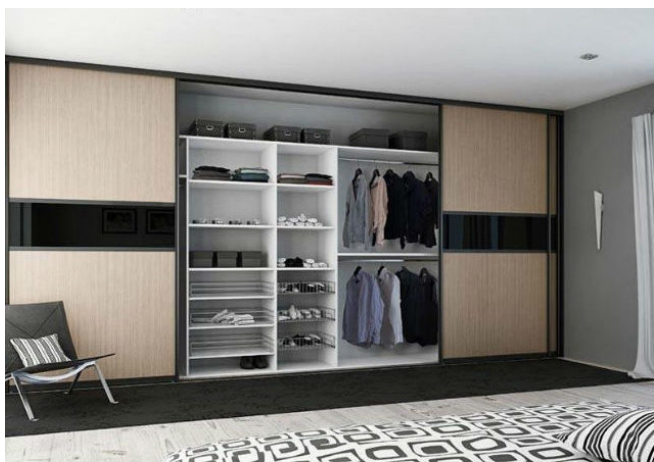
Рис. 8. Шкаф встроенный, 2022 г.

цифровых технологий как на этапе проектирования, где дизайнеры и конструкторы пользуются компьютерными программами для поиска решения мебели и определения ее оптимальной конструкции, подбора фурнитуры и расчета стоимости изделий, так и на стадии изготовления, где используются станки с ЧПУ, применяемые, например, для раскроя древесных плит или высококачественной и сложной обработки деталей из натуральной древесины и древесных плит. Цифровизация мебельной индустрии, очевидно, становится главным трендом последних лет.