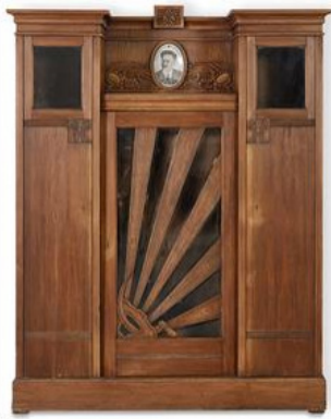
Рис. 3. Шкаф платяной, 1950 г.