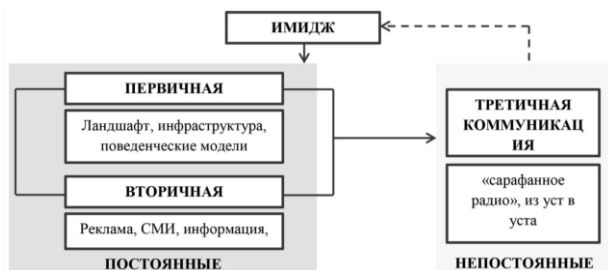
Рисунок 1. Модель территориального имиджа [9]

К моделям территориального имиджа относятся: модель М. Каваратзиса (рисунок 1), модель И.С. Важениной (рисунок 2).