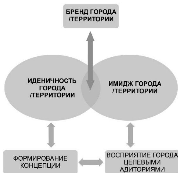
Рисунок 5. Модель территориальной идентичности бренда [7]