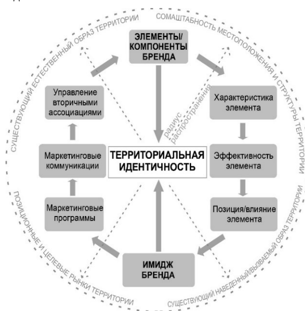
Рисунок 3. Модель территориальной идентичности бренда [10]

Ряд моделей территориального бренда основаны на понятии «идентичность». К таким моделям относятся: модель Л. Кайя (рисунок 3), модель М. Конечник-Рузира и Л. де Чернатони (рисунок 4), модель Д.В. Визгалова (рисунок 5). Также в данную группу можно отнести уже ранее рассмотренную модель туристического бренда С. Анхольта, так как в основу модели автором заложено понятие конкурентной идентичности.