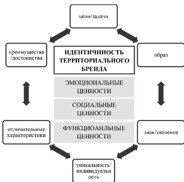
Рисунок 4. Модель территориальной идентичности бренда [11]