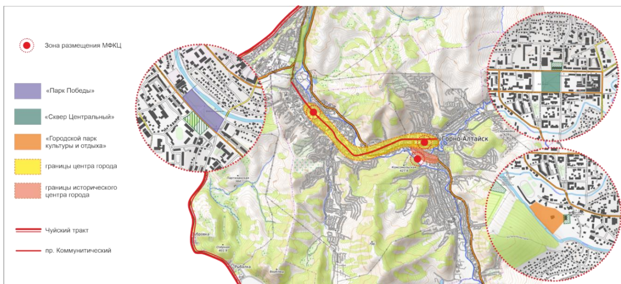
Рис. 1. Варианты размещения МФКЦ на территории города Горно-Алтайска

В ходе исследования была проанализирована градостроительная ситуация Горно-Алтайска и выявлены территории под размещение многофункционального культурного центра с учетом влияния их особенностей на объемно-планировочную структуру МФКЦ. При отсутствии в композиционной структуре города мест под размещение объекта с культурно-досуговыми функциями было бы логично привязать МФКЦ к намеченным в планах планировки и межевания территорий парковым зонам, зоне набережной или зонам активной общественной жизни города. Рассмотрим три варианта размещения многофункционального культурного центра: зона парка Победы, зона Центрального сквера и зона Городского парка культуры и отдыха.