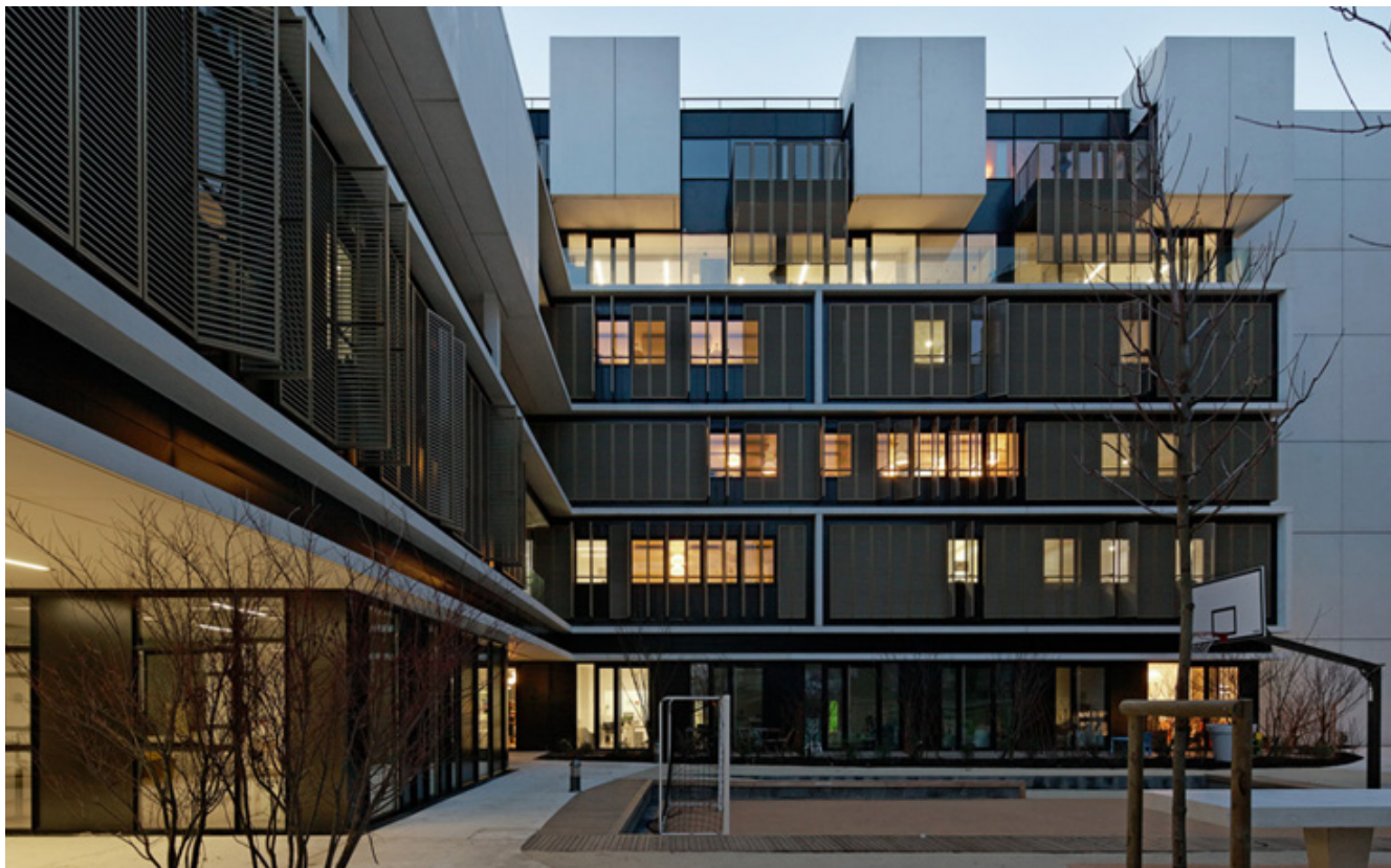
Рис. 3. Центр социального обеспечения для детей и подростков в Париже.

реждений, практически, во всем мире. Вторым важным элементом молодежного досуга в США являлся центр социальной помощи молодежи. Они начали свое распространение в 1960-е гг. и представляли собой центры, в которые подростки и молодые люди могли бы обратиться практически по любым вопросам, требующем общественной помощи [11].