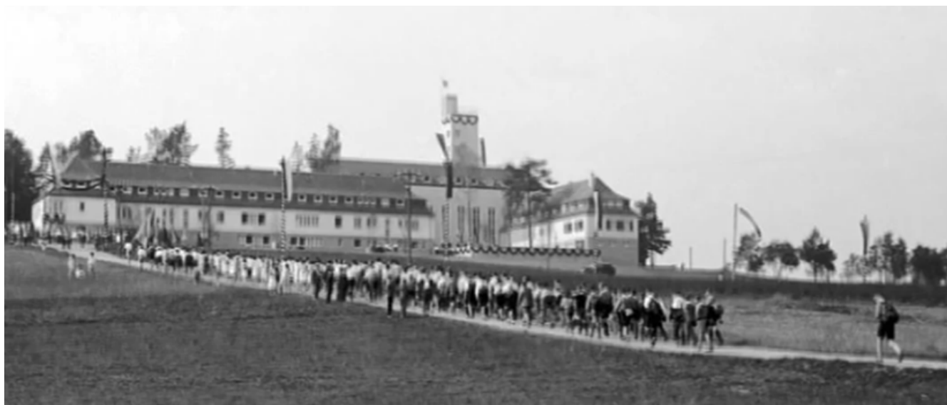
Рис. 1. Центр отдыха работающей молодежи Оттендорфа в Германии.

еще сложно говорить о формировании четкого понимания понятия «молодежный центр».