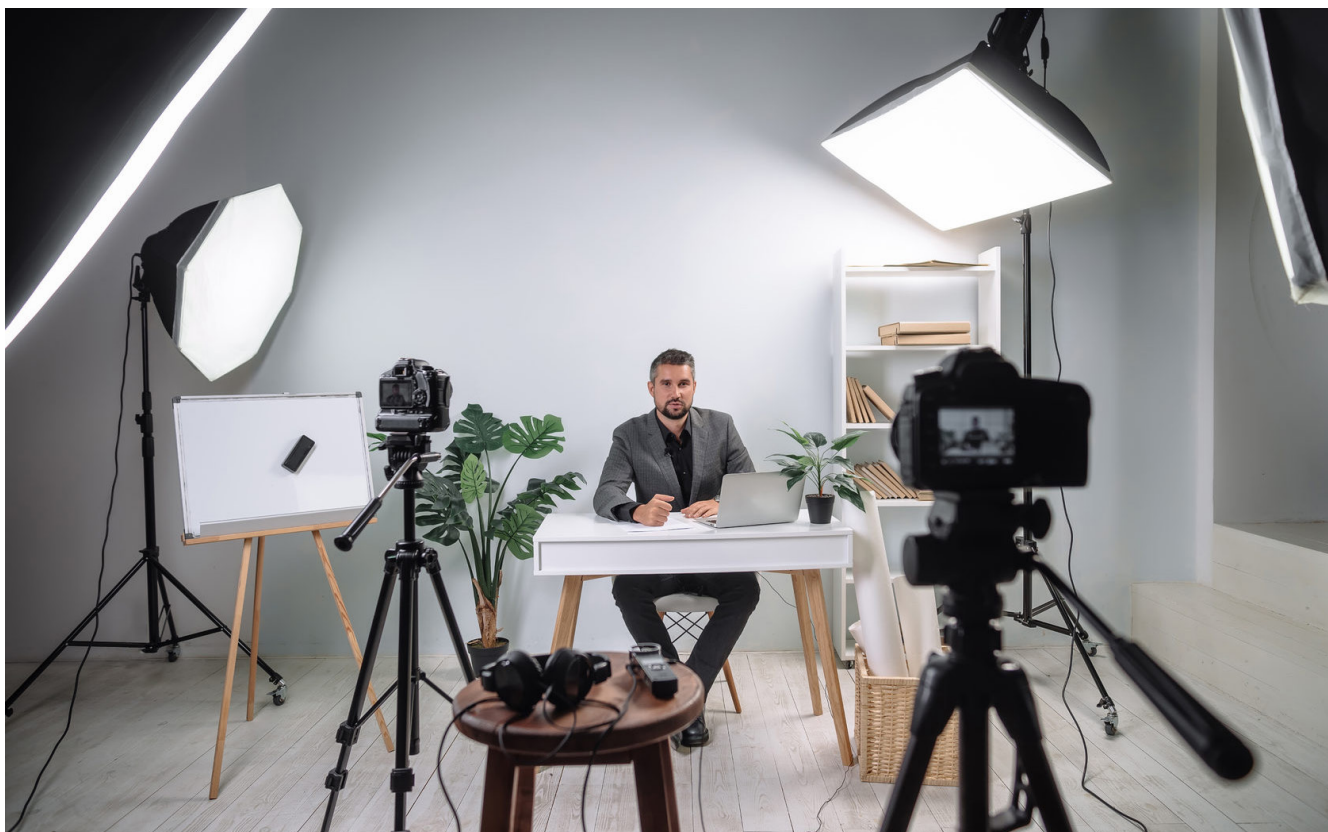
Рис. 1. Зона для офиса в квартире.

зопасность актуализировалась. Сюда отнесены вопросы по качеству материалов. Важно, из каких материалов выполнена отделка помещения, поскольку дешевая строительная продукция может быть токсична. Сырье должно иметь особую маркировку и соответствовать нормам экологической безопасности.