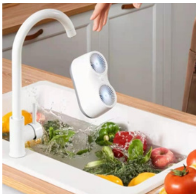
Рис. 2. Ультразвуковой очиститель.

ствуют у многих в доме, но мало кто знает, что большинство из них способны нанести вред, как здоровью человека, так и домашним животным. Большое скопление растений выделяют опасное количество летучих соединений [3]. Возможно выделение ядовитого сока, который может вы-