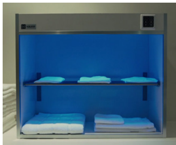
Рис. 4. Антибактериальный облучатель.

звать аллергическую реакцию при контакте с кожей. Домашний питомец, съев листок такого растения, вероятно, может заработать отравление. Есть несколько вариантов как избежать неприятного исхода: не ставить большое количество ядовитых растений в одной и той же комнате; следует периодически проветривать подобные помещения; а также устанавливать цветочные горшки в недоступных для детей и животных местах, например, подвешивать горшки к потолку. Но возможна и разработка специальных защитных объектов среды.