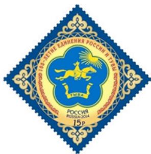
Рис. 16. Марка, посвященная 100-летию единения России и Тувы.

Тыва обладает своей первозданной природой и самобытной культурой. Главной особенностью республики является то, что на небольшой площади расположены почти все природные зоны Земли: пустыни и снежные шапки гор, степи и тайга, тундра и альпийские луга. Для развития туризма Тыва привлекательна богатым историко-культурным наследием и сохранившейся этнической культурой.