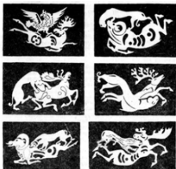
Рис. 9. Зооморфные скифские изображения.