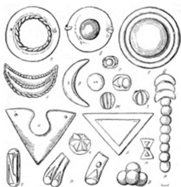
Рис. 1. Геометрические фигуры в украшении конской упряжи.

Выделяют следующие группы орнаментов: геометрические (ломаные, прямые, зигзаги, круги, ромбы и др.). Среди фигур геометрических чаще других древние скифы использовали форму круга. Круглые налобные подвесные украшения конской упряжи были найдены во всех раскопанных курганах. Квадраты и треугольники в качестве орнамента встречаются на одежде и на седлах. Фигуры ромба нередко можно ви-