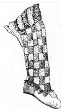
Рис. 2. Мужской сапог, украшенный квадратами.