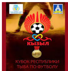
Рис. 17. Эмблема Кубка Республики Тыва по футболу среди мужских команд.