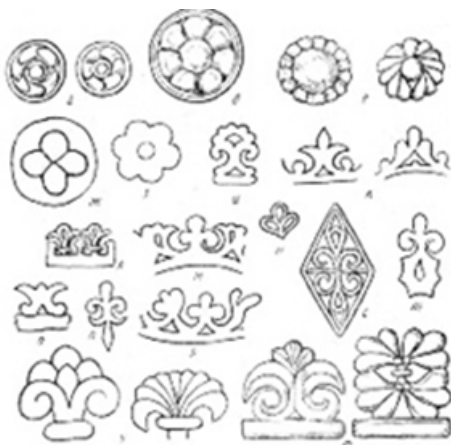
Рис. 6. Растительные скифские орнаменты.

Скифы верили, что изображения животных и частей их тел (глаза, лапы, клюв, хищно оиска-