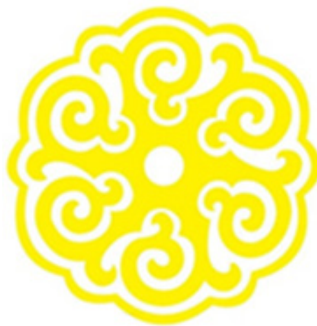
Рис. 15. Современные тувинские растительные орнаменты.

Растительные мотивы представлены, в основном, многолепестковыми розетками (чечек-теп), а также криволинейными фигурами, напоминающими растительные побеги (рис. 14–15).