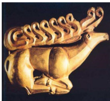
Рис. 8. Изображение оленя