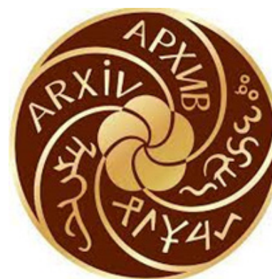
Рис. 26. Логотип Национального архива Республики Тыва.