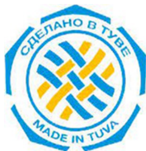
Рис. 11. Логотип «Сделано в Туве».

Примером использования геометрического орнамента в качестве графического стилизованного образа могут служить следующие логотипы (рис. 11–13).