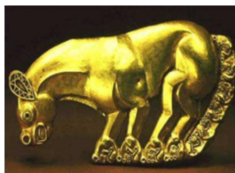
Рис. 10. Изображение пантеры.

ленная пасть, громадные рога), украшающие одежду и оружие, передавали этим вещам часть своих свойств. Эти изображения усиливали свирепость и бесстрашие воина, быстроту коня, придавали магическую силу оружию и меткость ударам.