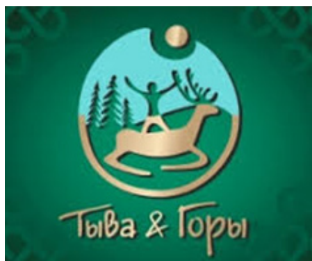
Рис. 22. Логотип туристического маршрута «Тыва и горы».