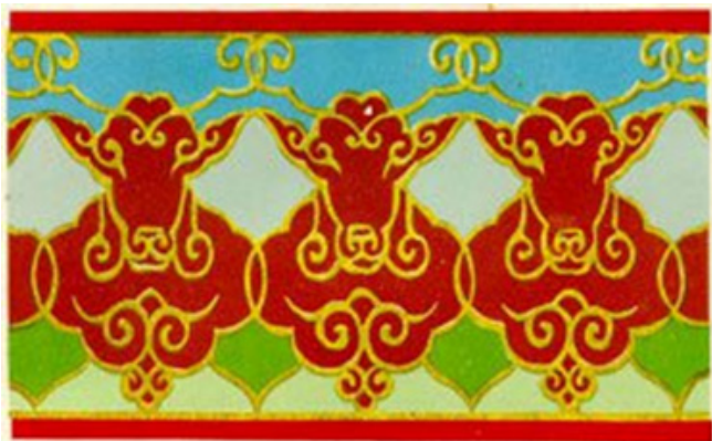
Рис. 19. Современный зооморфный орнамент.

Таким образом, развитие тенденции трансляции этнических образов позволит успешно формировать идентификацию региона на основе создания национальных туристических брендов Республики Тыва.