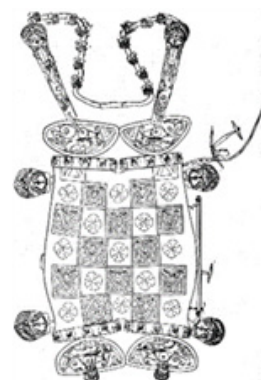
Рис. 3. Седло с геометрическим орнаментом.