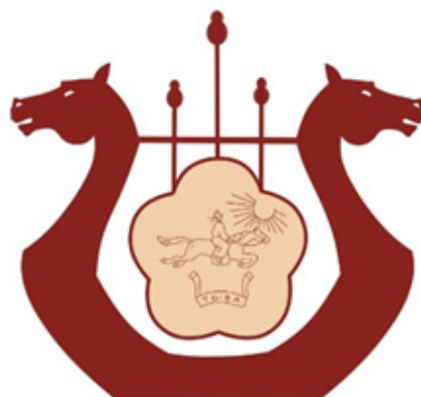
Рис. 25. Логотип Тувинской филармонии.