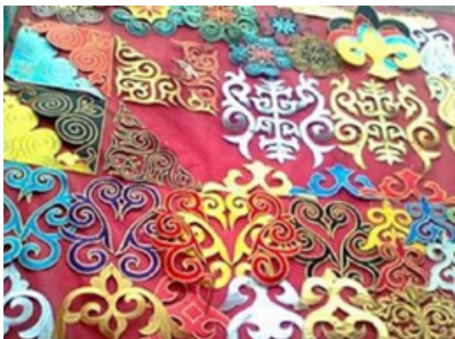
Рис. 14. Современные тувинские растительные орнаменты.