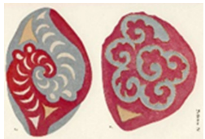
Рис. 7. Растительные скифские орнаменты.