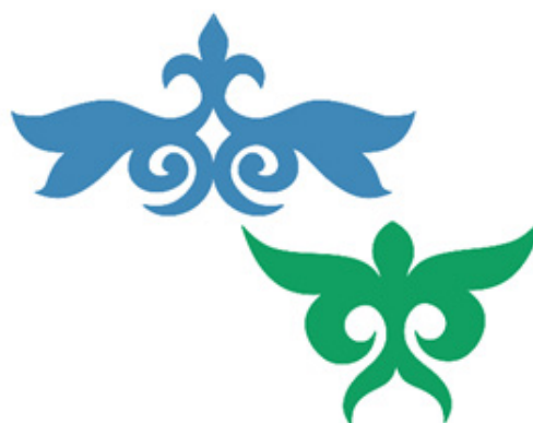
Рис. 20. Зооморфные символы в орнаменте. (Рисунок Фисенко Л.С.).