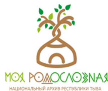
Рис. 18. Логотип Национального архива Республики Тыва.

Несмотря на свою уникальность и самобытность, Республика Тыва является регионом, в котором туризм практически не развит. Одной из причин слабого развития туризма в регионе является отсутствие успешного бренда республики, положительного имиджа в глазах людей