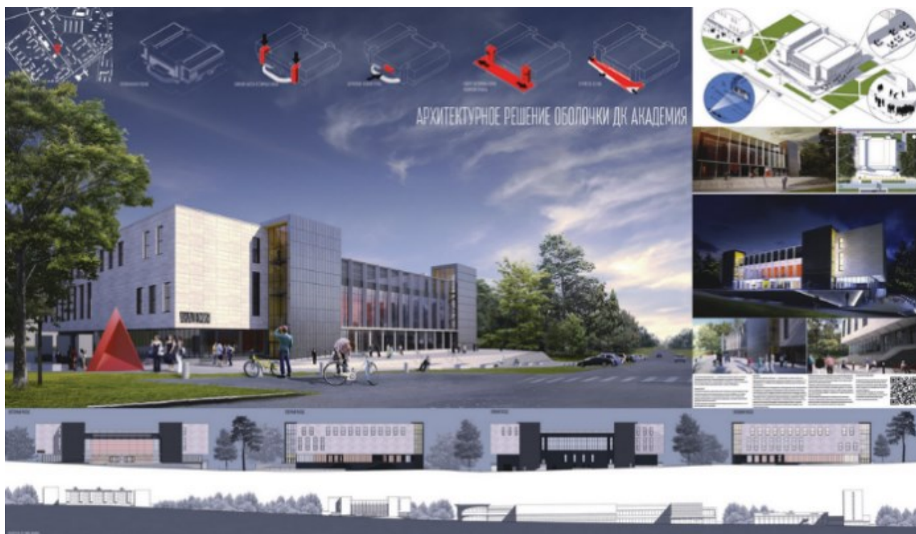
Рисунок 6. Архитектурное решение оболочки ДК Академия в Новосибирском Академгородке. [Вергасов Станислав, Панова Софья, URL: https://tehne.com/node/1544 ]