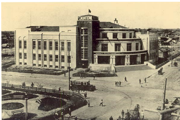
Рисунок 2. Дом культуры имени Октябрьской Революции. Автор инженер И. А. Бурлаков.