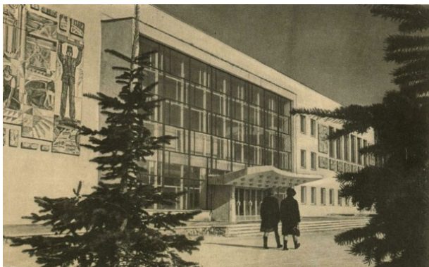
Рисунок 4. Дворец культуры «Строитель».