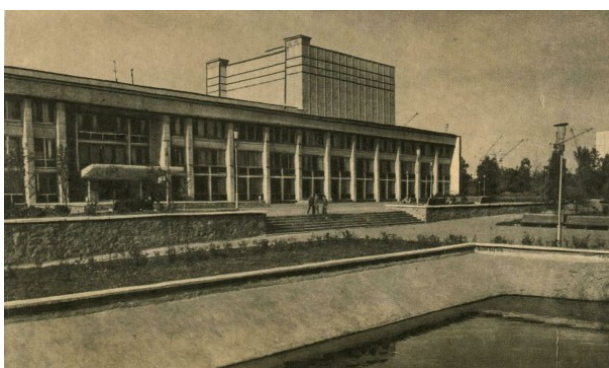
Рисунок 5. Дворец культуры железнодорожников. Фото. [Архитектурно-строительный справочник NovosibDom, URL: https://nsk.novosibdom.ru/node/299 ]